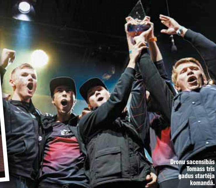
Dronu sacensībās Tomass trīs gadus startēja komandā.