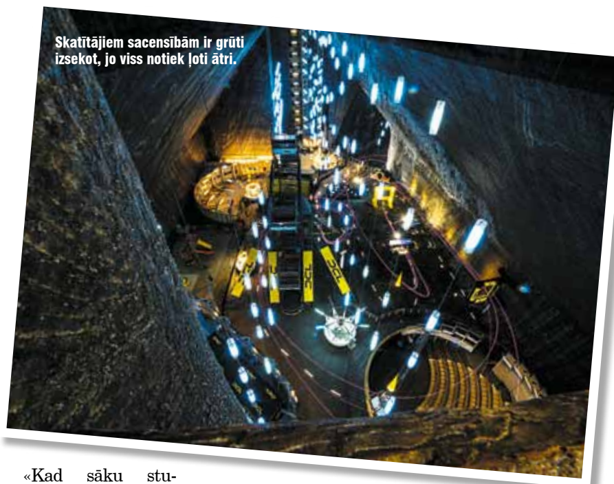
Skatītājiem sacensībām ir grūti izsekot, jo viss notiek ļoti ātri.